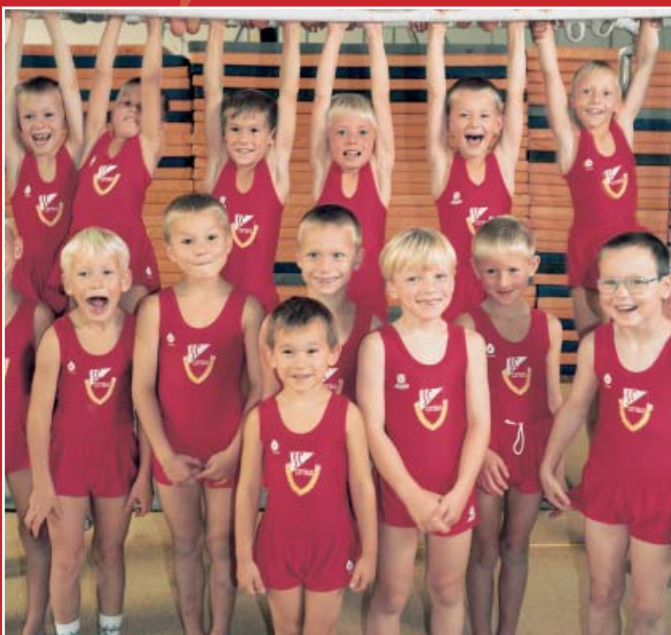
Die kleinsten Turner starten mit Spiel und Spaß

Sollte Ihr Kind im Anschluss an die Schnupperstunden Interesse am Turntraining haben, kann es für einen monatlichen Beitrag von 7 EURO unserem Verein als aktives Mitglied beitreten. Eine Familienmitgliedschaft (ab 3 Personen) bieten wir für 12 EURO pro Monat an. Unsere Mitgliedsbeiträge sind möglichst tief gehalten, um vielen eine Mitgliedschaft in unserem Verein bieten zu können. So zahlen Sie für Ihr Kind beispielsweise nicht mehr als 50 Cent pro Trainingsstunde.